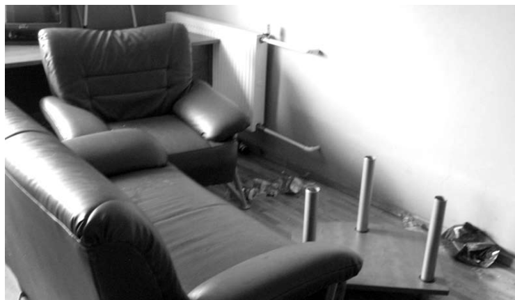
Po linksmybių „Puntuko“ viešbutyje penki jaunuoliai buvo išvežti į Anykščių policijos komisariatą.

Penki neblaivūs 1990–1996 m. gimę asmenys Anykščių policijos pareigūnų buvo sulaukyti ir uždaryti į areštinę.